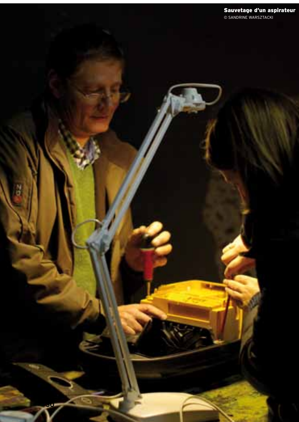
Sauvetage d'un aspirateur

Donneries, marchés gratuits, troc, compostage, potagers de quartier, Repair Café, gratifierias, dégustations de bon sens et autres initiatives citoyennes en faveur de la réduction des déchets et du recyclage fleurissent en Belgique. PAR VINCIANE MALCOTTE