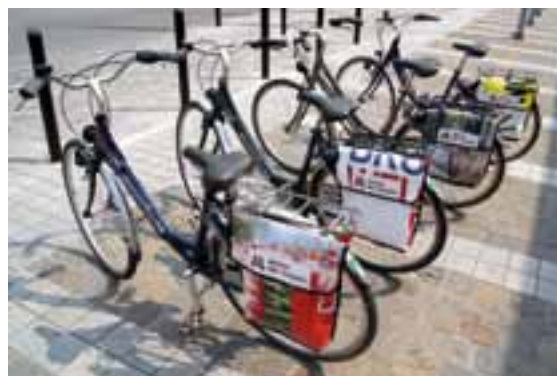
Des pubs transformées en sacoches pour vélos

On ne s'engage pas dans ce genre de projet sans de profondes convictions, et c'est le cas avec Design Point dans le domaine de l'économie sociale puisqu'ils collaborent avec des ateliers