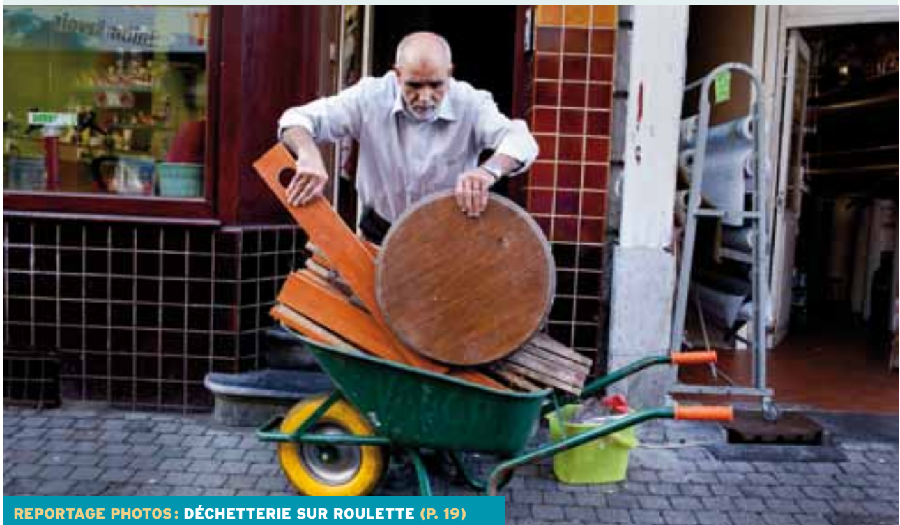
REPORTAGE PHOTOS : DÉCHETTERIE SUR ROULETTE (P. 19)