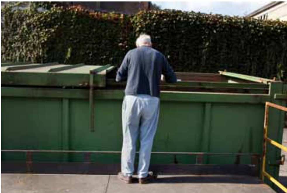
Intradel met à disposition quatre conteneurs de 10 m 3 et un grand conteneur de 30 m 3 . Cet habitant du quartier ne rate jamais l'occasion de liquider ses encombrants quand le parc mobile se déplace à lui.